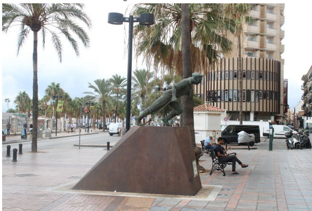
Památník rybářů „El jabegote“