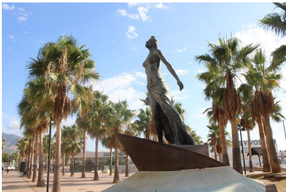
Alegorie Středomoří z roku 2003

Zdá se, že ve Fuengirole mají velkou zálibu v sochách. Několik jich je na promenádě a další na různých náměstích. Také skoro každý kruháč má uprostřed nějakou sochu, často spojenou s fontánou.