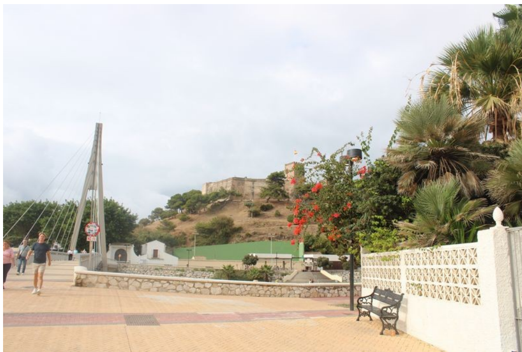
Puente de la Armada Española

Příjemná procházka po nábřeží vede až k řece Rio Fuengirola . Přes ni vede most pro pěší Puente de la Armada Española 2 postavený v roce 2006.