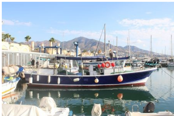
Pohled do maríny