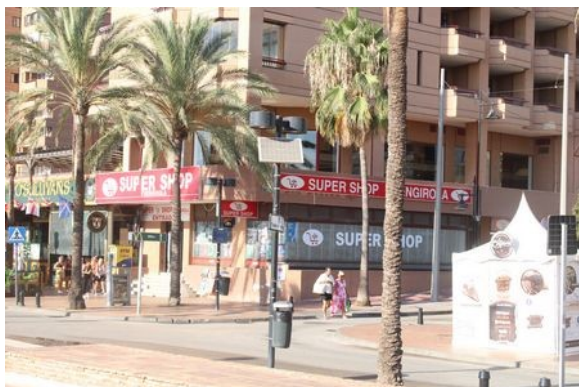
Náš oblíbený obchod

Jak už jsem se zmínil, náš hotel byl ve městě Fuengirola, a byl vlastně přímo na pobřeží. Stačilo přejít ulici Paseo marítimo Rey de España 1 a byli jsme u jachtařského přístavu. Tam nás zvědavost samozřejmě také zavedla.