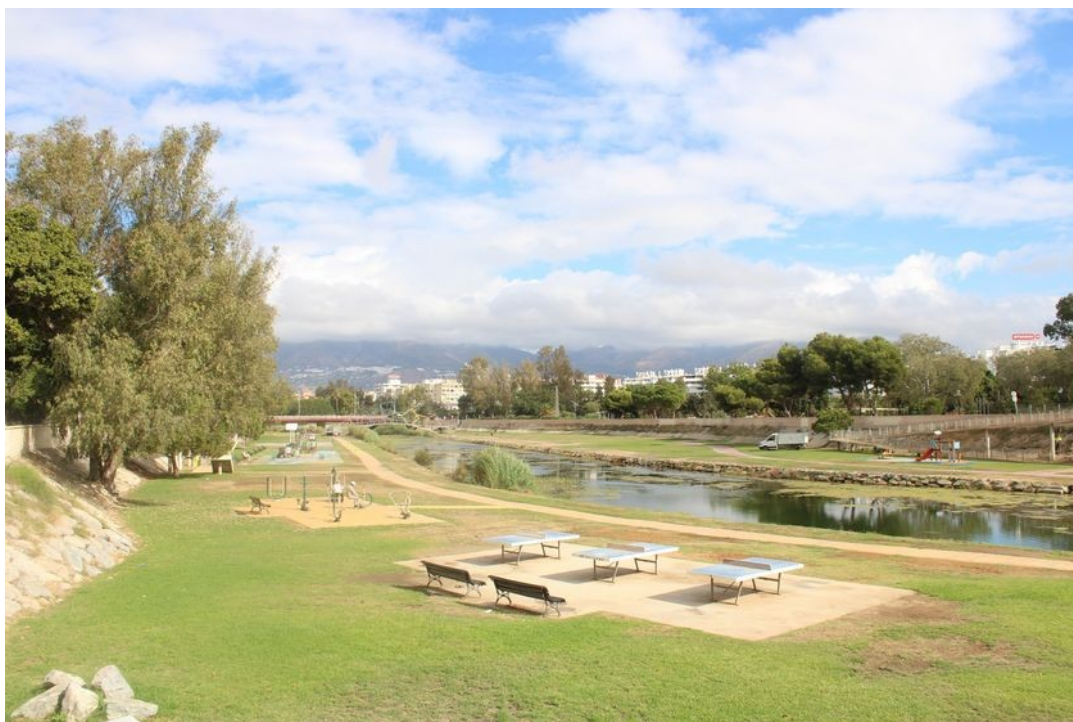
Po obou březích řeky je řada možností pro sport a zábavu.

Ještě kousek proti proudu řeky je obrovské obchodní centrum Miramar . Uvádí se, že je v něm více než 200 odchodů. Asi největší plochu zaujímá hypermarket Carrefour. Jinak jsou zde prodejny i u nás známých značek, zejména oblečení či kosmetiky, tedy žádná velká překvapení.