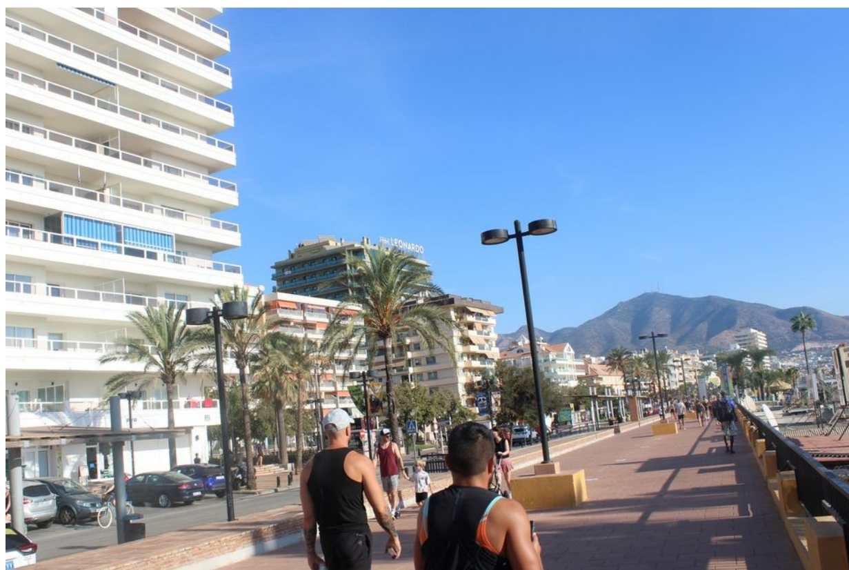
Za zmínku patrně stojí, že pruh promenády pro pěší je podstatně širší než pruh pro vozidla.