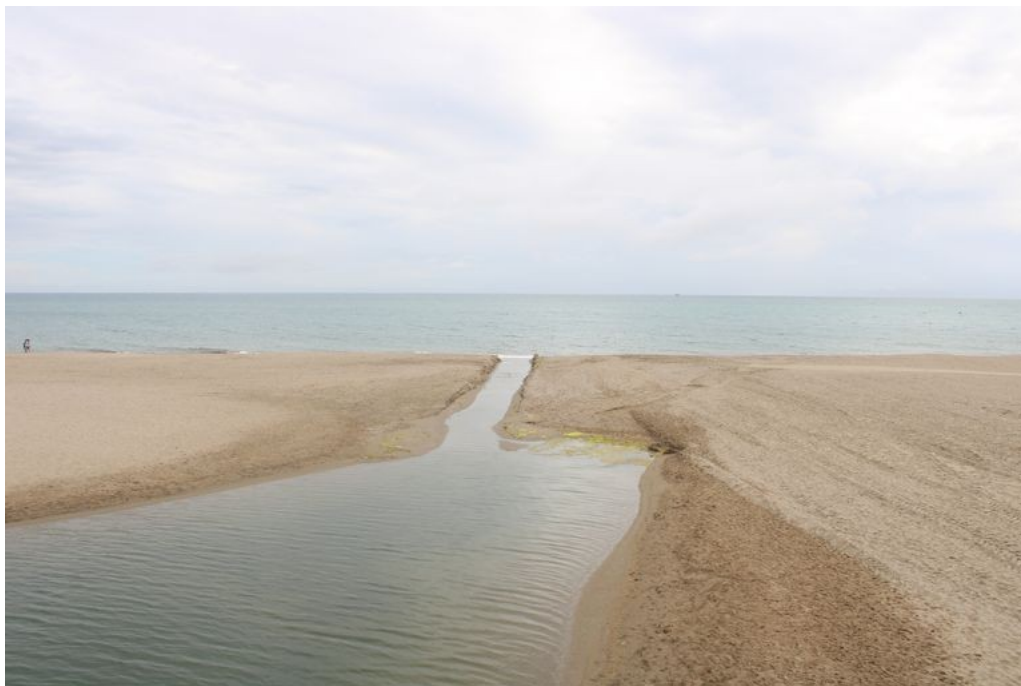
Ústí řeky Fuengirola