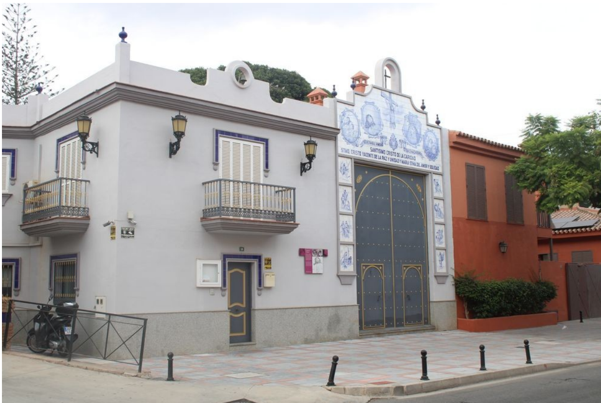
Kaple Nejsvětějšího Ježíše s kachličkovou výzdobou

Zajímavé jsou uličky starého města. Dodnes zde na řadě domů najdeme výzdobu ornamentálně dekorovanými obkládačkami. Někde jsou z kachlíčků sestavené i obrazy. Vzhledem k dostatku mramoru jej najdeme nejen na obkladech domů, ale často i jako dlažbu chodníků. V malebných uličkách jsou i malé obchůdky a možnosti občerstvení.