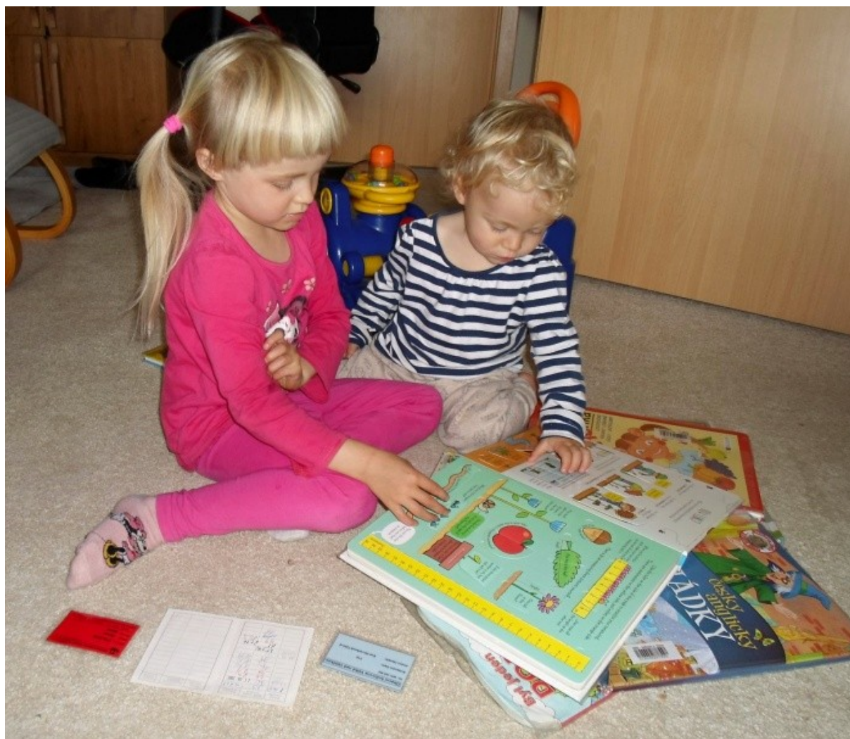
Zbrusu nová průkazka na fotce vlevo dole

Vzpomínáte na ty naše? Kdysi pradávno jen lístek, pak přeložená kartička. A objevy v knihovnách. Ransomovky a jiné a další. Povolných bylo třeba jen 3-5, mnohdy jsem četla už za chůze cestou domů. Dnes to už nejde, z 5 různých knihoven nosím plné tašky nebo těžký batoh.