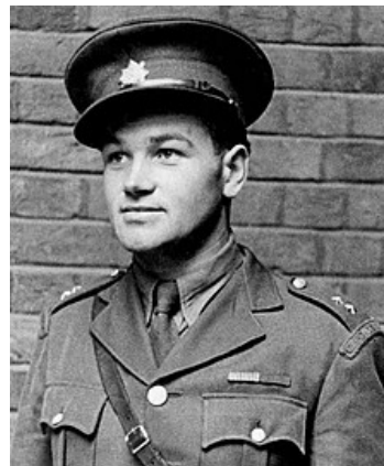
Rotmistr Jan Kubiš (1941)