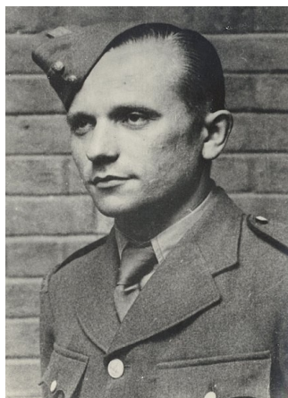
Rotmistr Jozef Gabčík (1941)