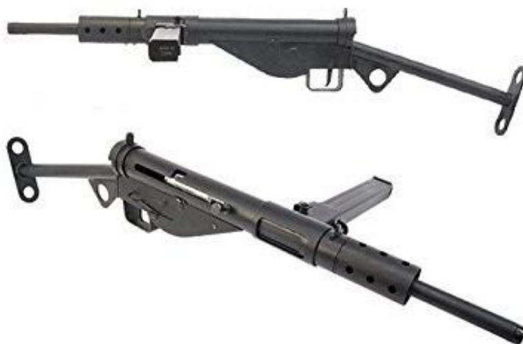
Sten gun Mk II