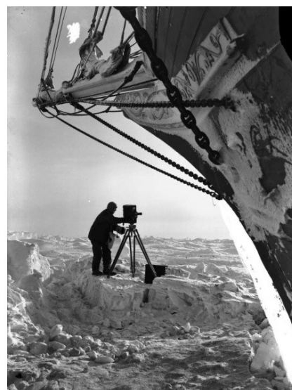
James Francis Hurley – fotograf expedice

Minimálně dva z dvaceti osmičlenné posádky by si zasloužili samostatný medailonek. Jednak sám vedoucí výpravy a James Hurley, kameraman a fotograf expedice. Právě Hurley přesvědčil Shackletona, že je třeba zachránit i filmy a fotografické desky. Díky němu si dnes můžeme prohlížet autentické fotografie a filmové záznamy.