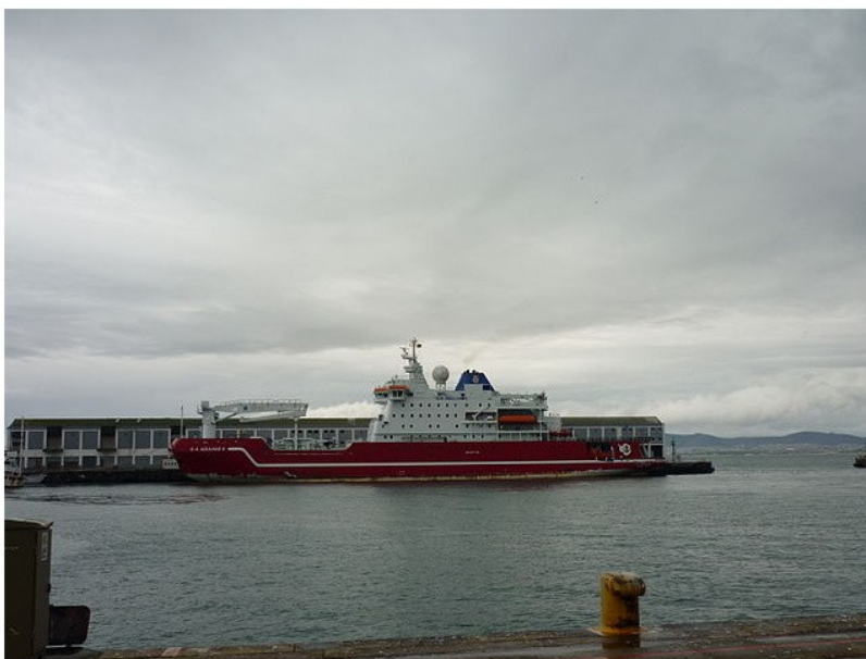
Ledoborec S. A. Agulhas