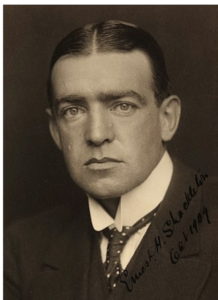
Sir Ernest Henry Shackleton