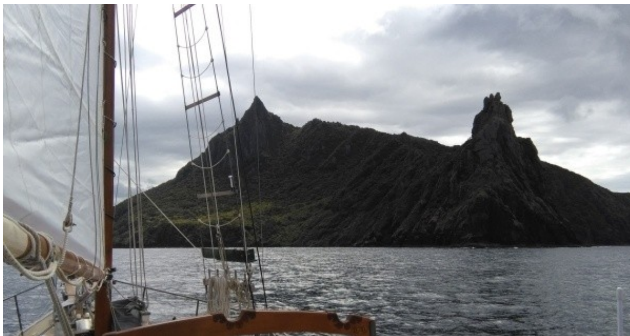
Krabí ostrov zblízka

Většina dnešních cestujících rodin stejně jako naši synové a vnuci využívá možnost dálkového studia. Dnes to usnadňuje rozšíření autopilotů, které osvobozuje rodiče i děti od „tyranie“ kormidlování, a nakonec i satelitní internet. Přesto je i dnes stále rozšířené domácí učení podobně jako na palubě Divoké kočky . Pro učení se využívá i příležitostné řešení problémů podle