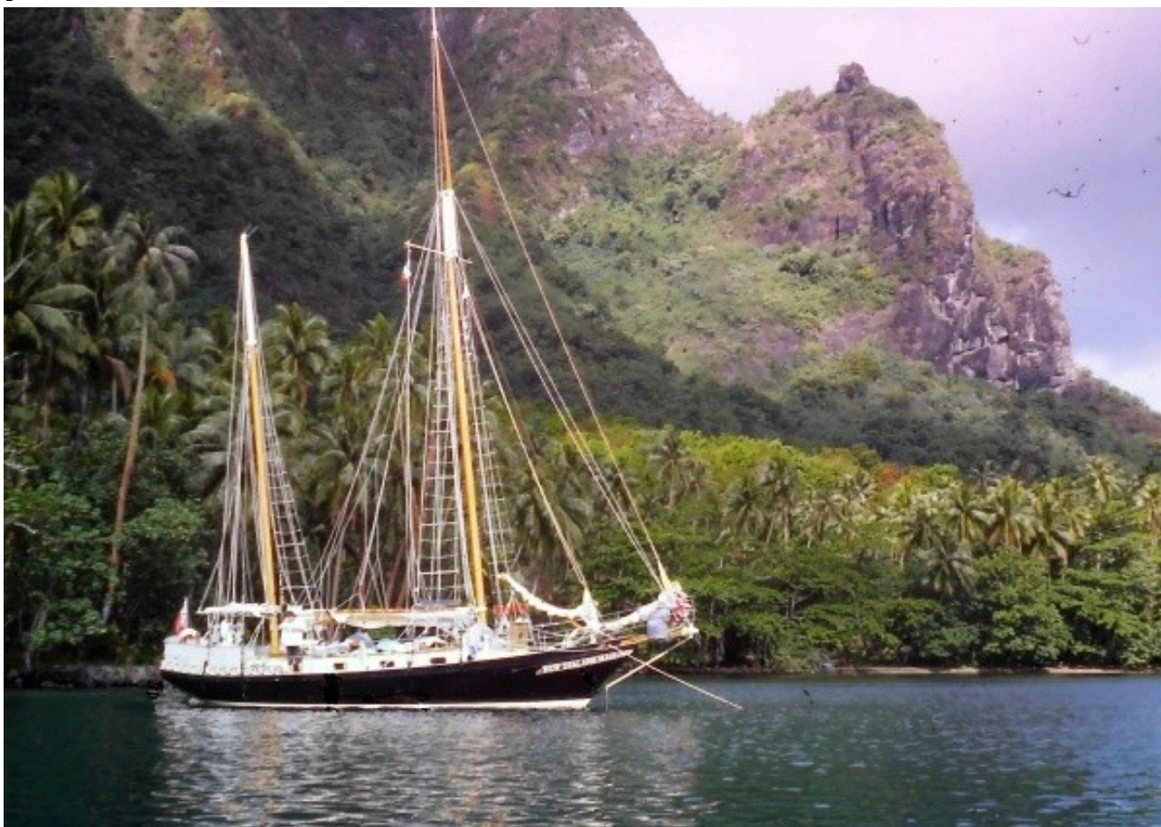
New Zealand Maid 3 kotví u břehu Krabího ostrova

toho, jaké se zrovna vyskytnou. Nancy a John se zabývali astronomickou navigací, Zuzana a Peggy přepočítávaly ubývající zásoby potravin a pitné vody. Všichni mladí členové posádky těžili ze znalostí svých mentorů Petra Kachny a mladého Billa a zdokonalovali se v námořnické praxi. A samozřejmě byla během cesty spousta příležitostí k pozorování přírody – počasí, ryb a ptáků. Jejich zážitky byly velmi podobné těm, které měli cestující děti v nedávné minulosti. Naším synům pomáhala i obsažná loďní knihovna.