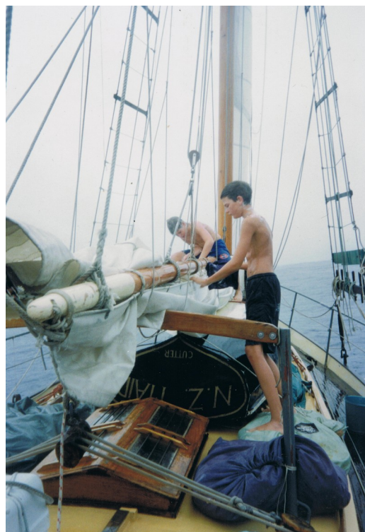
a na New Zealand Maid