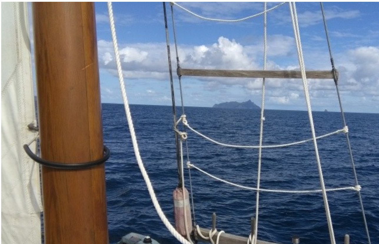
Krabí ostrov na obzoru