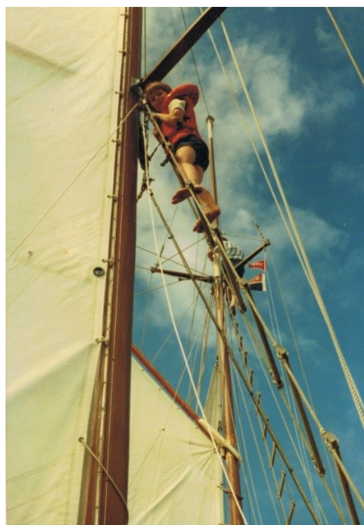
Dan na upínačkách

Když byli naši chlapci ve věku V+A, také museli počítat záblesky majáků a zakreslovat polohu na papírovou mapu, stejně jako to s kapitánem Flintem dělali Nancy a John, když v kapitole VIII míjeli majákové lodě. Snadno si dokážeme představit Ransoma na palubě Nancy Blackett se stopkami v ruce, jak při plavbě Kanálem La Manche kontroluje časování záblesků majákových lodí East Goodwin a South Foreland stejně jako červená a zelená boční světla blížících se plavidel.