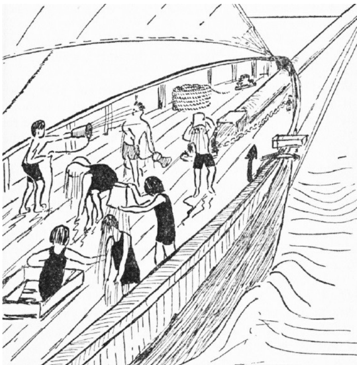
Ranní mytí na Divoké kočce