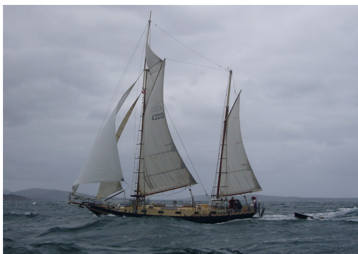
New Zealand Maid

Mám podezření, že mnoho nadšených ctitelů A. Ransoma netuší o množství dětí, které se v posledních desetiletích plaví po oceánech. Zde v nejsevernější marině Nového Zélandu (Opua), kde je náš keč právě vyvázaný, je každé léto vidět doslova stovky zahraničních plachetnic, které se sem sjíždějí, aby v relativním bezpečí přečkaly období pacifických hurikánů. Záliv je plný dětského smíchu. Tucty mezinárodních jachtařských rodin se zde znovu setkávají pro letní zábavu v přátelském prostředí.